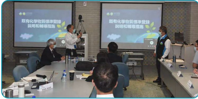
環保署化學局許仁澤組長(右)向會員說明登錄措施原則與作業的建議

特別邀請環境保護署毒物及化學物質局許仁澤組長、金承漢技正，就「既有化學品物質標準登錄說明和輔導措施」，與 TCIA 會員進行現場溝通。