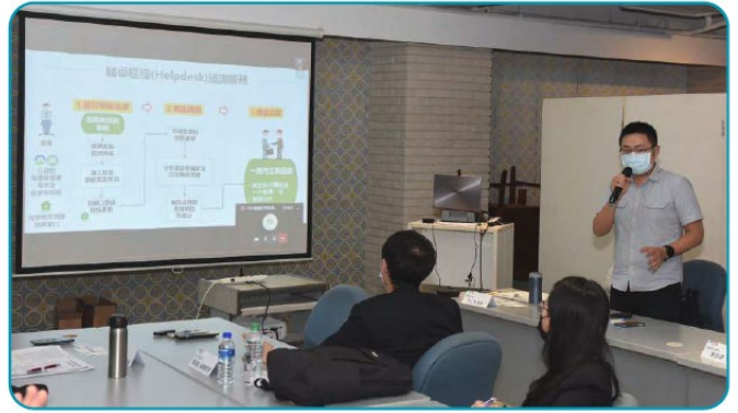
化學局金承漢技正建議業者能由盤點開始，逐步補滿登陸需求訊息)